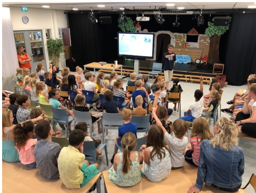
De middenbouwers weten nu alles over het Waddengebied!

Voor de aandachtsgebieden 'financiën' en 'onderwijskunde' zoeken wij nog twee kandidaten. Mocht je interesse hebben of iemand kennen (mag ook buiten Hoevelaken, binding met de school is geen vereiste) dan houden wij ons van harte aanbevelen!