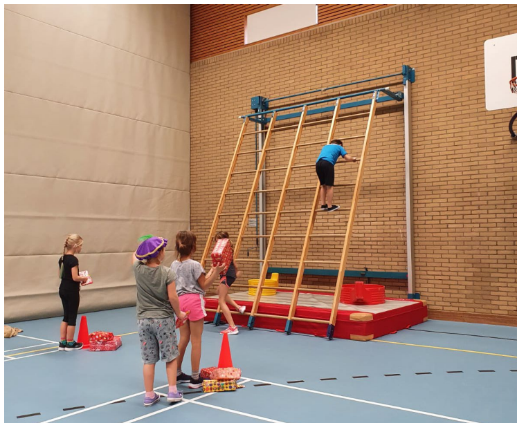
Pietengym in de middenbouw!