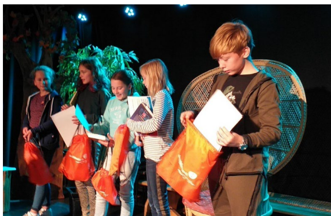
Onze voorleestalenten in de bovenbouw!